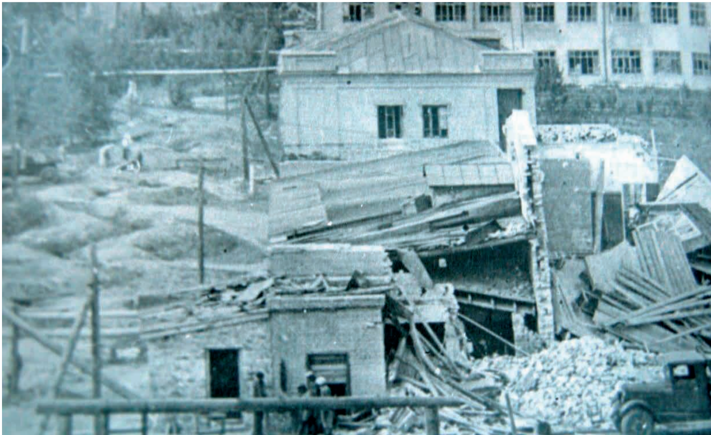
После бомбардировки завода. Справа цех № 13, вдалеке главное заводоуправление. На переднем плане разрушенный здравпункт. Центральная дорога между цехами № 13 и 14 вся в воронках от бомб

В ходе зимнего 1942-1943 годов наступления Красной Армии и последовавшего контрнаступления вермахта в Восточной Украине в центре советско-германского фронта образовался большой выступ глубиной до 150 км и шириной до 200 км и общей протяженностью 550 км - так называемая «Курская дуга». Немецкое командование решило под Курском «взять реванш», окружить и уничтожить в районе Курского выступа наши войска, вернуть себе утраченную стратегическую инициативу.