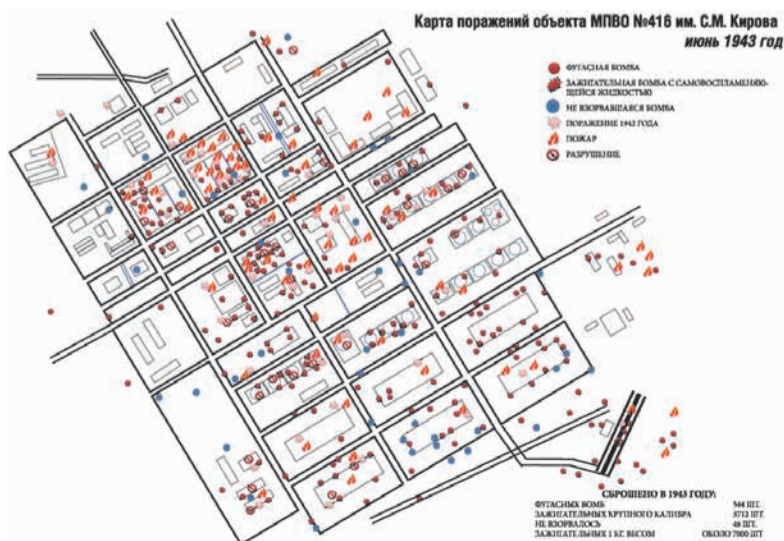
Карта поражений Саратовского крекинг-завода № 416 в 1943 году. На завод сброшено 544 фугасных бомб весом 250-500 кг, зажигательных бомб крупного калибра 3712 шт., не взорвалось 46 бомб

С 25 июня, сразу же после прекращения налетов, приступили к восстановлению разрушенного хозяйства завода, в июле 1943 заработали уже 40 % мощностей 416-го завода, полное восстановление потребовало полгода. За первый месяц после восстановления предприятие перевыполнило план на 150%. Топливо пошло на фронт.