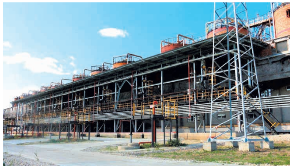
Битумная установка сегодня