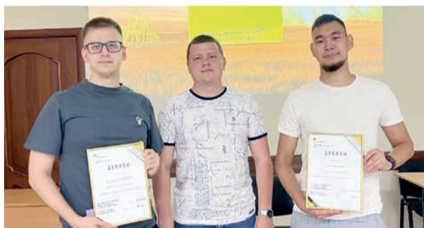
Отчетное собрание молодежи

В ходе экскурсии гости ознакомились с технологическими установками производств №1 и №2, с процессами нефтепереработки, а также узнали о видах выпускаемой продукции и истории Саратовского НПЗ.