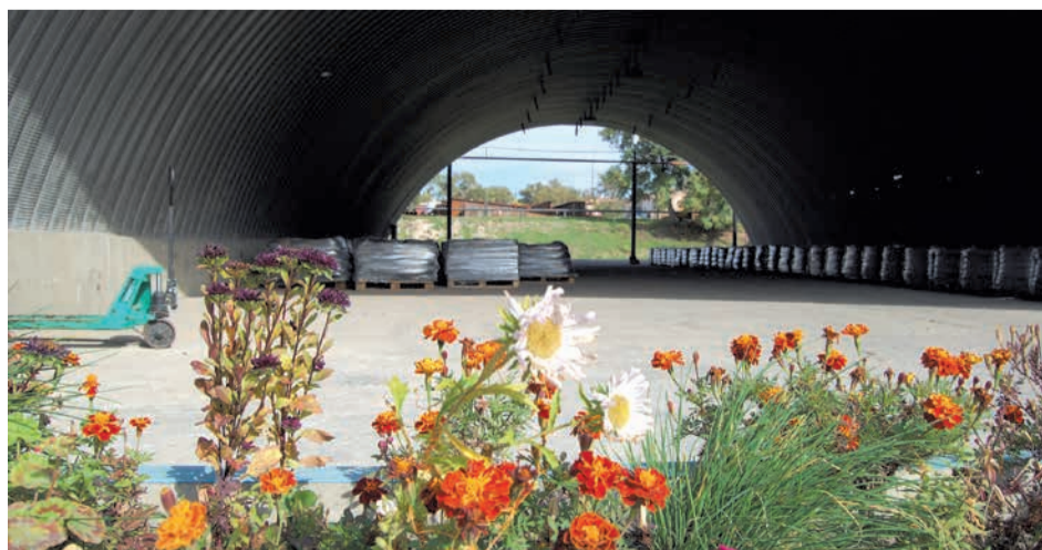
7 октября 2011 года. Работницы установки старались сделать ее красивой

2011 год. «Лучше всех в Компании Саратовский НПЗ прошел проверку Ростехнадзора, получил меньше всех замечаний и не оставив ни одной установки. Ни пропусков оборудования, ни разливов нефтепро-