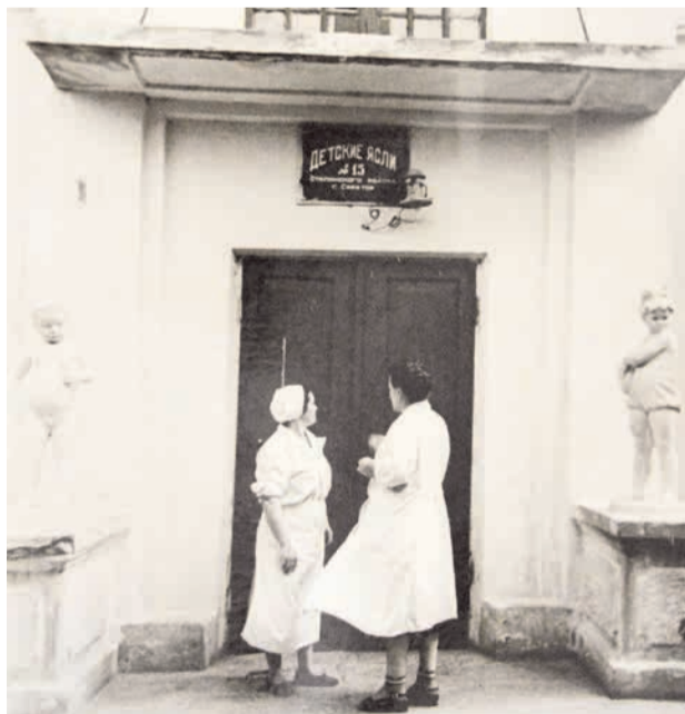
Детсад. Сейчас центр здоровья

В июне 1945 года началось строительство стадиона.