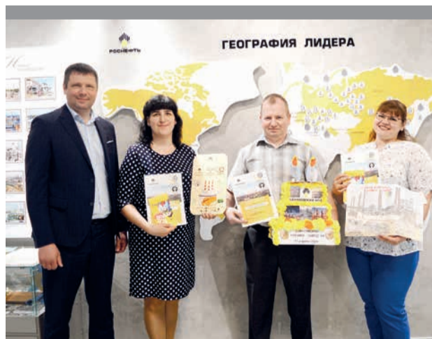
Победитель конкурса поделок к юбилею завода

Все участники и победители были награждены памятными подарками.