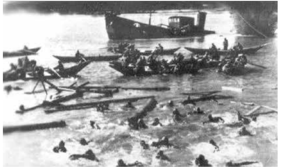
Первый набор ребят в заводское ремесленное училище №7. 1940 г.

В первые три дня после трагедии наши пожарные доставали тела погибших из воды и складывали их рядом со школой №16. Более 260 тел достали пожарные из воды. Трагедия заключалась еще и в том, что оборудование на барже не было закреплено. Когда баржа начала складываться, станки и листы металла начали давить и резать