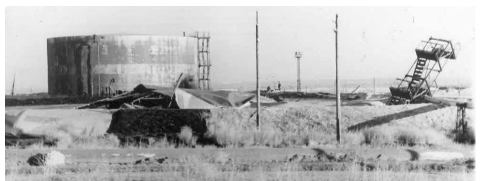
Резервуарный парк после бомбардировки завода в 1942 году

20 сентября 2021 года, в 79-ю годовщину гибели людей на барже, состоялось торжественное открытие нового памятника и возложение цветов к малой и большой братским могилам.