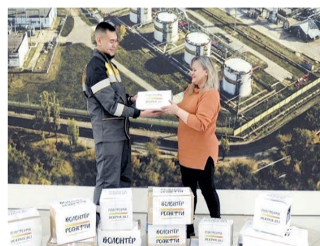
Сбор гуманитарной помощи