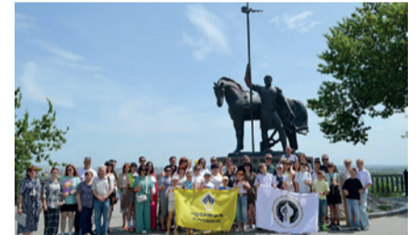
Экскурсионная поездка в Пензу (с посещением зоопарка, океанариума и обзорной экскурсией по городу) (5 поездок).