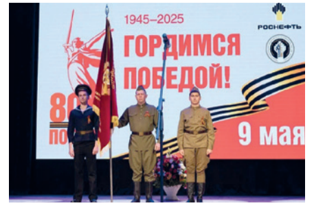
Патриотический концерт, посвященный празднованию Дня Победы и шествие Бессмертный полк.