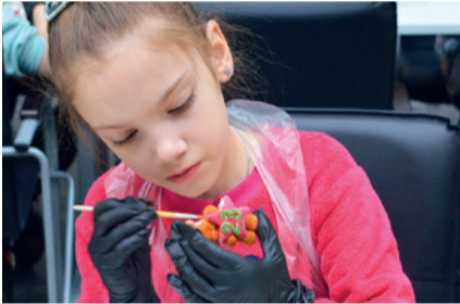
Занятие ДК «Всезнайка». Детский мастер-класс по росписи гипсовых фигурок «Подарок самым близким».