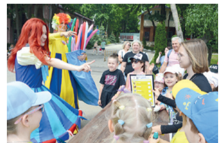
Праздничное мероприятие, посвященное Дню защиты детей.