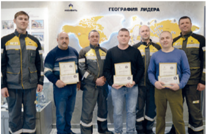
Торжественное награждение победителей конкурса «Лучший уполномоченный по охране труда».