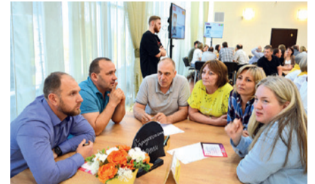
Организация интеллектуальной игры «Страна. Завод. Люди. Победа» для работников ПАО «Саратовский НПЗ» (11 команд).