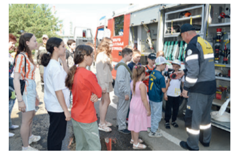
Экскурсия по заводу для детей работников Общества (2 Экскурсии).