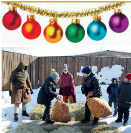
Семейное мероприятие в русских народных традициях «Масленица».