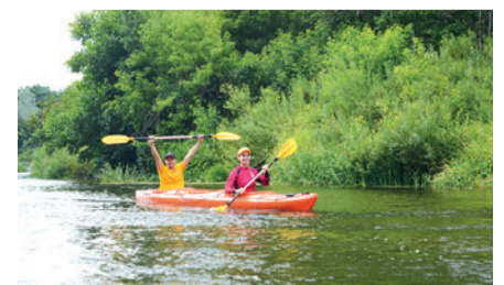
XXVII Туристический слет (сплав на байдарках по р. Медведица) - (2 дня).