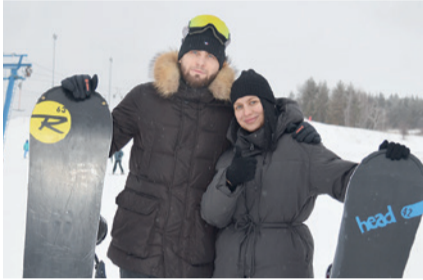
Дни здоровья в парке отдыха «Хвалынь» (5 поездок).