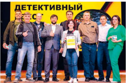
Детективный исторический квест «Вперед в прошлое» для работников завода, приуроченный ко Дню Великой Победы.