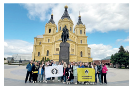
Экскурсионный тур в Нижний Новгород.