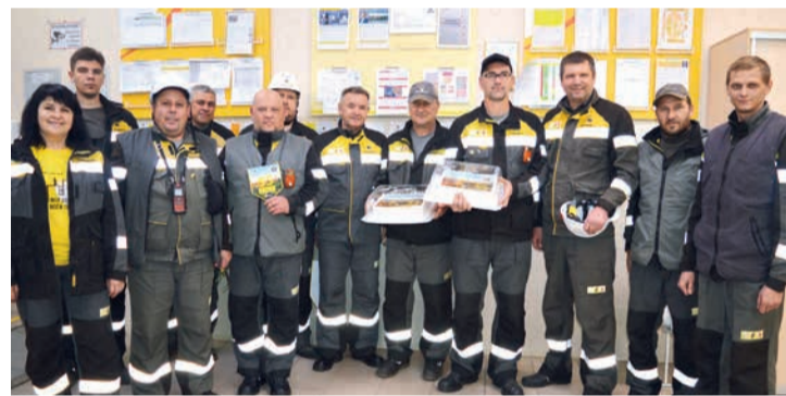
Поздравление коллектива УПЭС с 55-летним юбилеем