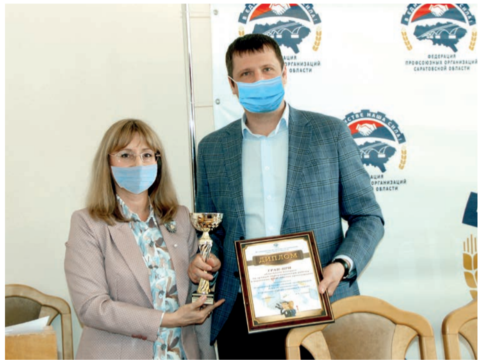
Профсоюз Саратовского НПЗ завоевал Гран-при конкурса Федерации профсоюзных организаций Саратовской области на лучшую постановку информационной работы.

Президиум Российского Совета профсоюза решил направить оператора из