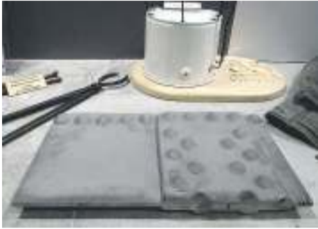
Небольшой кусок клепаного резервуара подарен заводскому музею работниками УТН