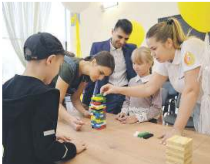
Молодые профсоюзные активисты играли с детишками перед мероприятием

В завершении программы каждому ребенку вручили портфель с набором первоклассника, также всех порадовал эффектный, как полное звездное небо, салют из золотого конфетти.